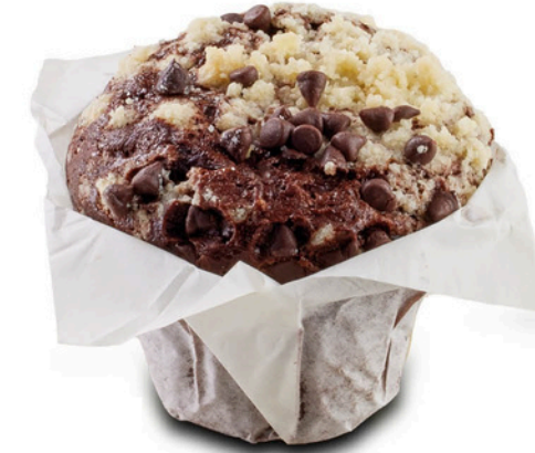
Çikolatalı Muffin CHOCOLATE MUFFIN