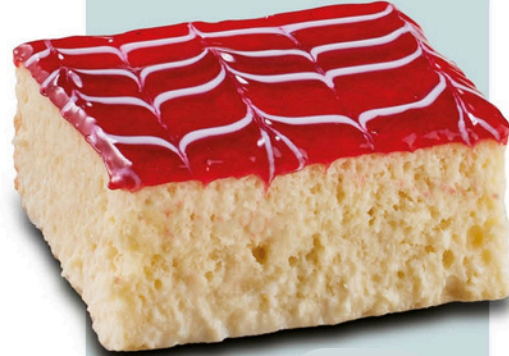
Frambuazlı Trileçe RASPBERRY TRES LECHES