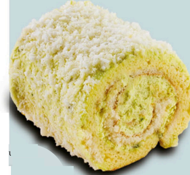
Antep Rulo PISTACHIO ROLL