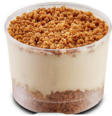
Lotus Magnolia LOTUS MAGNOLIA