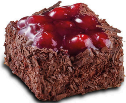
Bella Vista BELLA VISTA