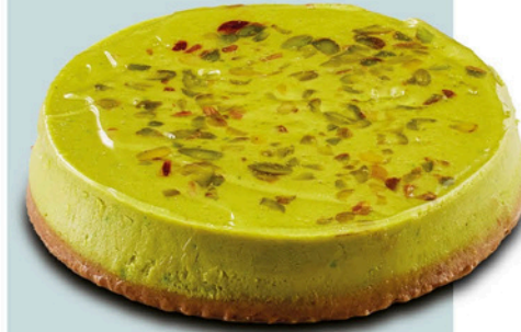
Antep Fıstıklı Cheesecake PISTACHIO CHEESECAKE

+4 ° C'de 3 saatte çözündürünüz. Çözündükten sonra tekrar dondurmayınız. +4 ° C'de 4 gün içerisinde tüketiniz.