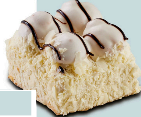
Beyaz Profiterollü WHITE PROFITEROLE