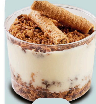
Rulokat Magnolia RULOKAT MAGNOLIA