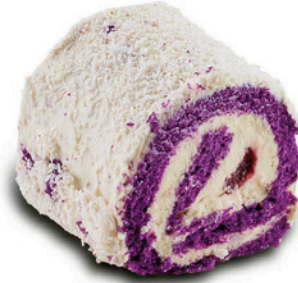
Mor Menekşe PURPLE VIOLET