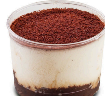
Kase Tiramisu TIRAMISU CUP