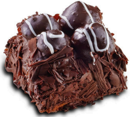
Siyah Profiterollü BLACK PROFITEROLE