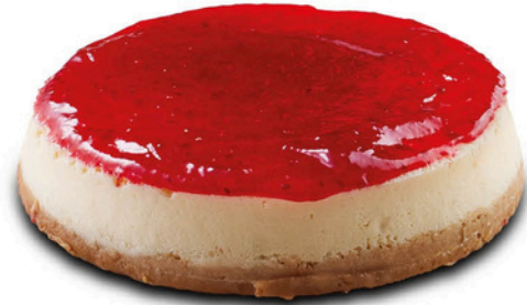
Frambuazlı Cheesecake RASPBERRY