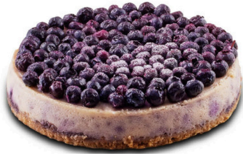
Yaban Mersinli Cheesecake BLUEBERRY