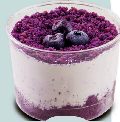
Yaban Mersinli Magnolia BLUEBERRY MAGNOLIA