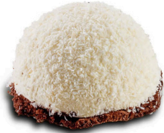
Hindistan Cevizli Top COCONAT BALL