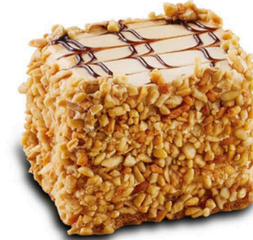
Latte LATTE CAKE