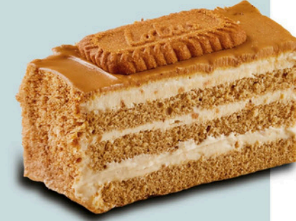
Lotus LOTUS CAKE